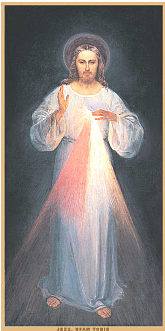
JEZU, UFAM TOBIE

PFARRBRIEF DER PFARREIEN KÖSCHING - KASING - BETTBRUNN 09.04. - 22.04.2018